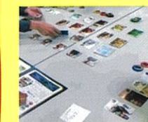
ゲーム例：宝石の煌めき