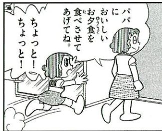
後期 チンプイ「魅惑のマール料理」