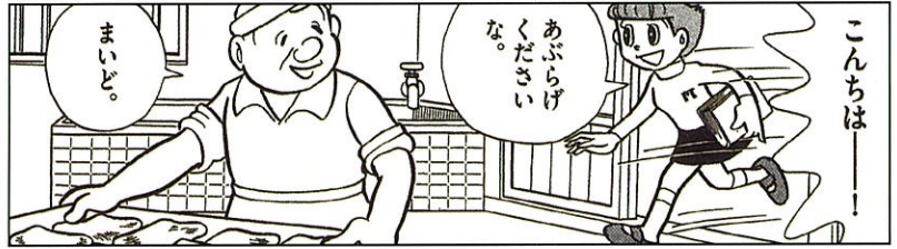
前期 エスパー魔美「勉強もあるのだ」