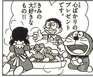
前期 ドラえもん 「しずちゃんの心の秘密」

※期間によって展示する原画が変わります。 展示原画は予告なく変更することがあります。