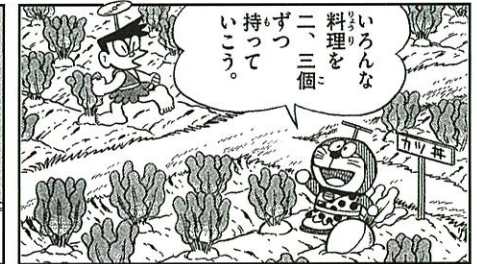
後期 大長編ドラえもん「のび太の日本誕生」