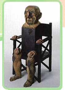
マリソール(ピカソ) 1981年