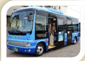
路線バス乗り方教室