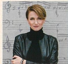
モニカ・ヴォリニスカ(指揮)