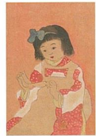
◎大正6年度卒業生作品