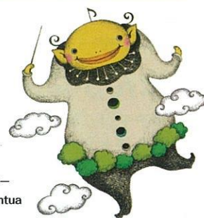
音楽祭イメージキャラクター ガルガンチュア Gargantua