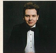
マテウシュ・クシジヨフスキ(ピアノ)