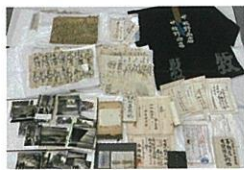
レスキューした被災資料(一部)

2月1日(土)～7月6日(日)/高岡市立博物館 新館第1企画展示室 本展では、当館収蔵の衣・食・住に関わる生活道具「民具」を展示し、その歴史や用途、人々のくらしについて紹介します。 ★併設展示「被災資料レスキュー展」も開催